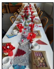
Festlich gedeckter Kaffeetisch