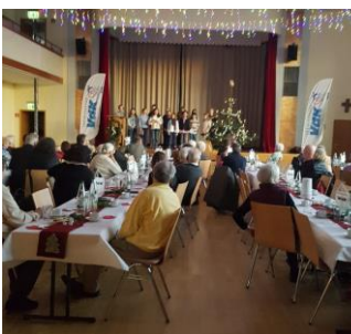
VdK-Adventsfeier im KGZ St. Josef