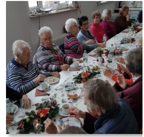
Nikolaus-Bingo bei Kaffee und Kuchen

Die Präsente werden uns größtenteils gespendet. Falls Sie neuwertige Gegenstände im handlichen Format - ähnlich wie auf dem Foto links - übrig haben, die unseren Teilnehmerinnen und Teilnehmern gefallen könnten, würden wir uns über die Abgabe in der Geschäftsstelle sehr freuen.