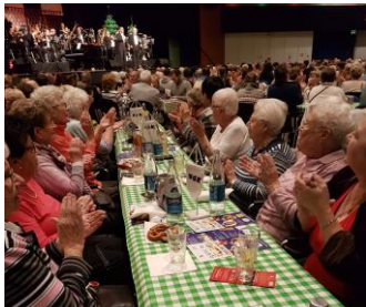
VdK-Tisch in der Hugenottenhalle