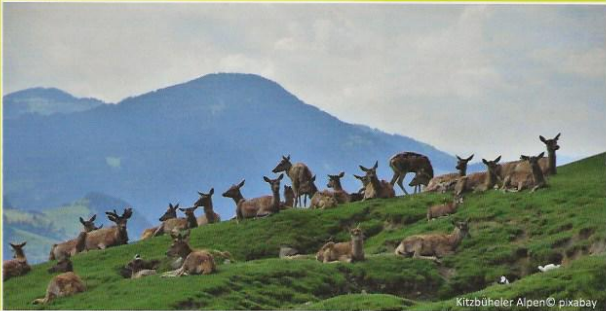
Kitzbüheler Alpen © pixabay