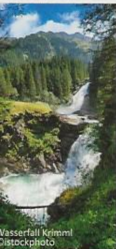
Wasserfall Krimml