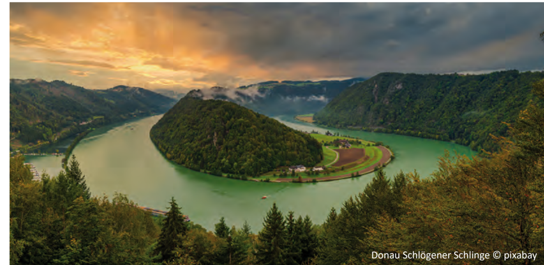
Donau Schlägener Schlinge

Lernen Sie unter diesem Motto die „Königin der Flüsse“ kennen. Von Passau aus geht es in drei verschiedene europäischen Länder und Sie besuchen Wien, Bratislava und Budapest. Zahlreiche Ausflüge laden Sie ein, verschiedene Städte, Länder und Leute kennen zu lernen. An Bord der MS Carmen können Sie die Hektik des Alltags vergessen und sich rundum verwöhnen lassen.